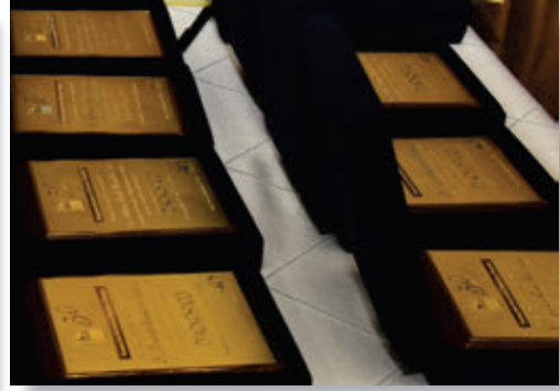
Invitados a la ceremonia de homenaje a la Revista "Diagnóstico" por su 40° Aniversario.